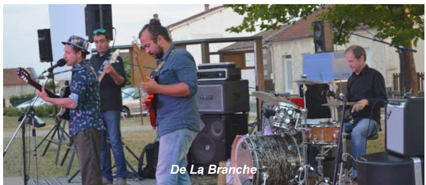
De La Branche

A l'issue du reportage, autour du verre de l'amitié, on a continué à échanger sur ce passé douloureux, dont on recommence à parler depuis quelques années. ENFIN.