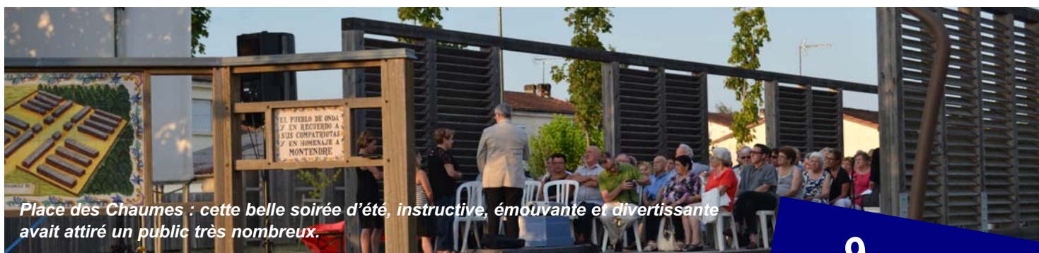
Place des Chaumes : cette belle soirée d'été, instructive, émouvante et divertissante avait attiré un public très nombreux.