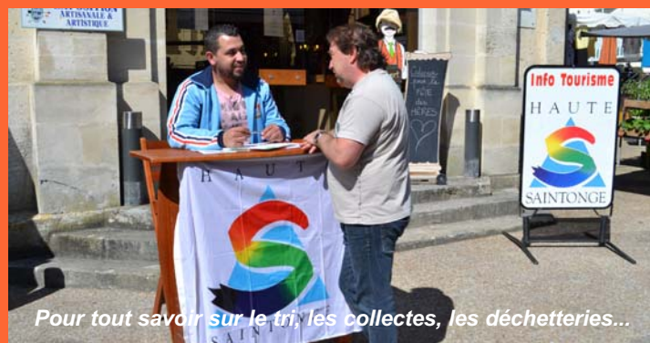
Pour tout savoir sur le tri, les collectes, les déchetteries...

que... En 2014, un haut saintongeais a apporté environ 199 kg de déchets en déchèterie.