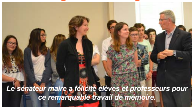
Le sénateur maire a félicité élèves et professeurs pour ce remarquable travail de mémoire.