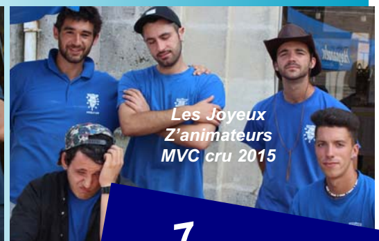
Les Joyeux Z'animateurs MVC cru 2015