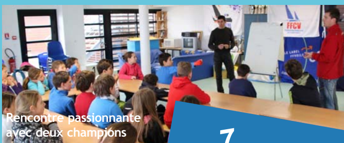
Rencontre passionnante avec deux champions