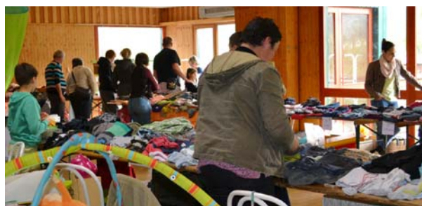
Acheter jouets ou vêtements d'occasion à tout petit prix : un nouveau mode de consommation économique et durable qui séduit !

Après une première édition réussie à l'automne, l'association Mamuse et Méduque organisait en avril pour la seconde fois, une bourse à l'enfance (vêtements bébés et enfants, livres et jouets, équipements divers de puériculture d'occasion). Ces manifestations ont pour but de collecter des fonds afin d'organiser des animations destinées aux moins de trois ans. Cette fois encore, parents-vendeurs et parents-acheteurs sont venus en nombre et ont fait de bonnes affaires. Un succès !