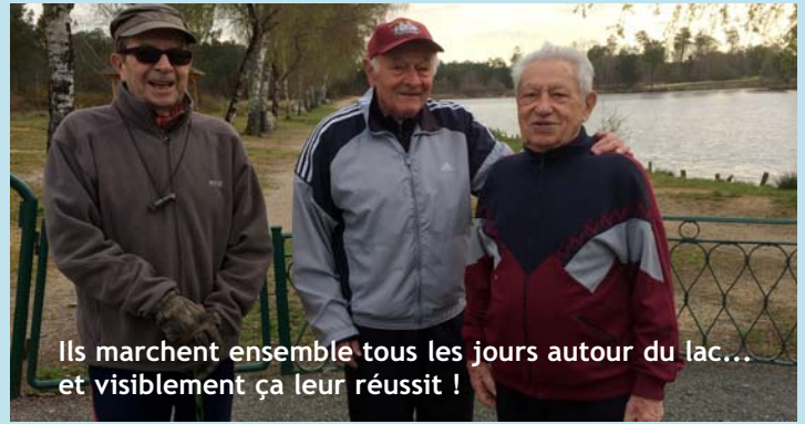
Ils marchent ensemble tous les jours autour du lac... et visiblement ça leur réussit !