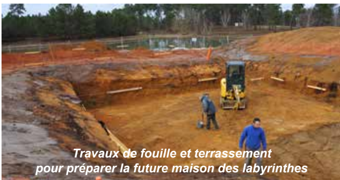
Travaux de fouille et terrassement pour préparer la future maison des labyrinthes

Pendant ce temps, des opérations de plantation ont été réalisées à l'intérieur du parc (partie clôturée) et à l'entrée : c'est là que se situera le "babyrinthe", destiné aux petits ; visible depuis la route, il sera en accès libre et gratuit.