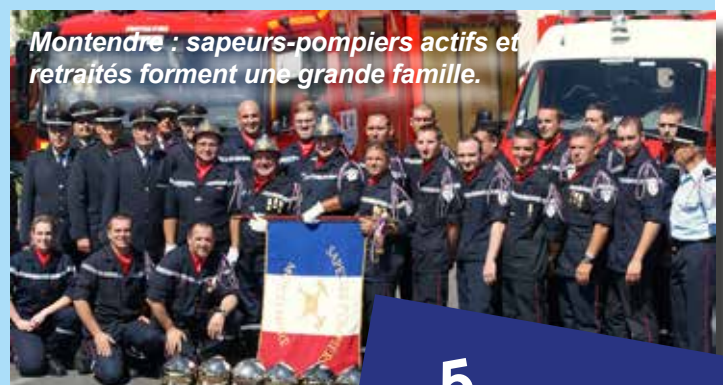
Montendre : sapeurs-pompiers actifs et retraités forment une grande famille.

N'hésitez pas à venir nous rencontrer lors de nos gardes des dimanches ou à nous adresser votre candidature au Centre de Secours, 25 boulevard de Saintonge à Montendre ou par mail à chef-cs-montendre@sdis17.fr