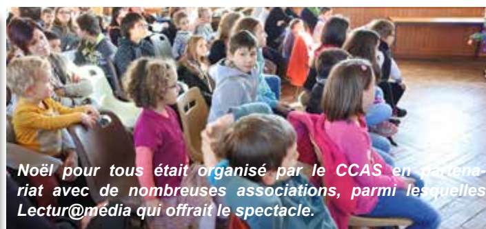
Noël pour tous était organisé par le CCAS en partenariat avec de nombreuses associations, parmi lesquelles Lectur@média qui offrait le spectacle.