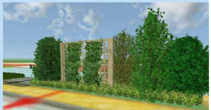
Projet de création d'un espace vert sur la bande aménagée entre la contre-allée et l'avenue de la Gare

Ces travaux sont éligibles au soutien financier du Conseil Départemental de Charente Maritime, au titre du Fonds d'aide départemental pour la revitalisation des centres des petites communes (20%), et par l'Etat, au titre du programme 122 action 01 du budget du Ministère de l'Intérieur (50%), la commune conservant à sa charge 30% des investissements soit 51 000 €.