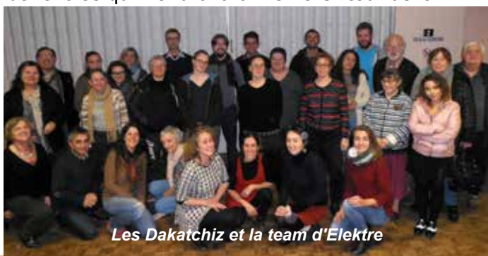
Les Dakatchiz et la team d'EleKtre

Le projet sera participatif et intégrera de nombreux bénévoles qui viendront former le Chœur de la