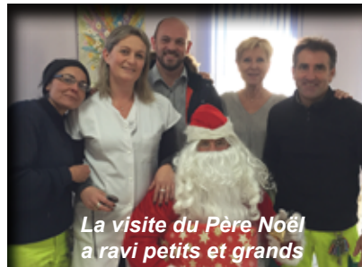
La visite du Père Noël a ravi petits et grands