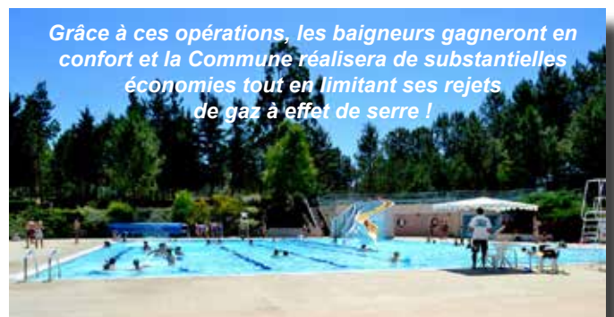
Grâce à ces opérations, les baigneurs gagneront en confort et la Commune réalisera de substantielles économies tout en limitant ses rejets de gaz à effet de serre !

Les travaux se sont poursuivis avec l'ouverture de l'accès entre la future salle de projection et le local réserve qui se situera en lieu et place de l'actuel préau : celui-ci sera fermé et recouvert de bardage bois. A l'intérieur de la salle, le plan incliné a été profilé à l'aide de calcaire, mais il faut encore beaucoup