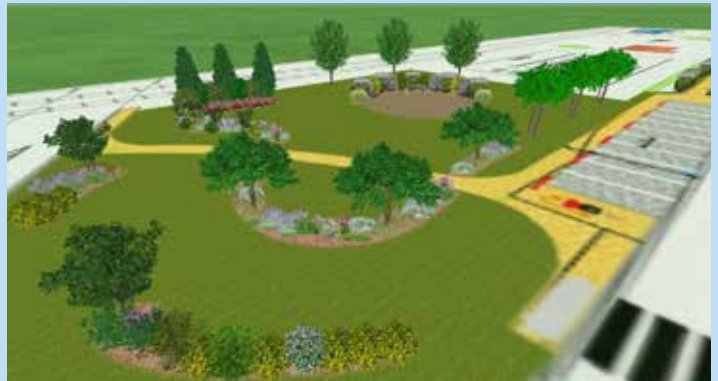
Projection d'aménagements en lieu et place de la maison du garde-barrière

L'ensemble de cette opération représente un investissement de 170 299,86 € HT maîtrise d'œuvre du Syndicat Départemental de la Voirie incluse.