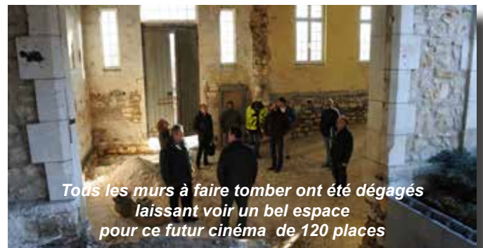
Tous les murs à faire tomber ont été dégagés laissant voir un bel espace pour ce futur cinéma de 120 places

d'imagination pour y voir une future salle de cinéma... Les travaux ne sont pas terminés mais on sait leur issue très attendue des cinéphiles !