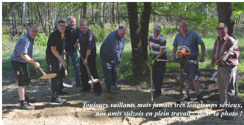
Toujours vaillants mais jamais très longtemps sérieux, nos amis sulzois en plein travail... pour la photo !

La fine équipe s'était cette fois-ci recomposée autour d'un nouveau projet : la construction d'un abri à vélos, en bois, derrière la maison de Sulz (près du village de vacances). Un projet certes moins ambitieux mais pas moins utile, pour les vacanciers allemands lors de leurs futurs séjours à Montendre. Venus en camions, les bénévoles sulzois avaient apporté leur outillage et les matériaux utiles à leur réalisation, principalement du sapin de la Forêt Noire.