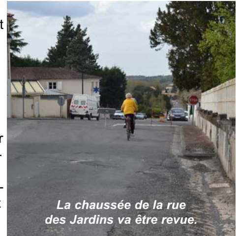
La chaussée de la rue des Jardins va être revue.

et optimiser le stationnement. Le projet prévoit aussi l'installation d'un sanitaire pour personnes à mobilité réduite. Les cheminements piétonniers seront mis aux normes pour les personnes handicapées tout comme l'accès depuis le parking vers le bâtiment du Conseil Général.