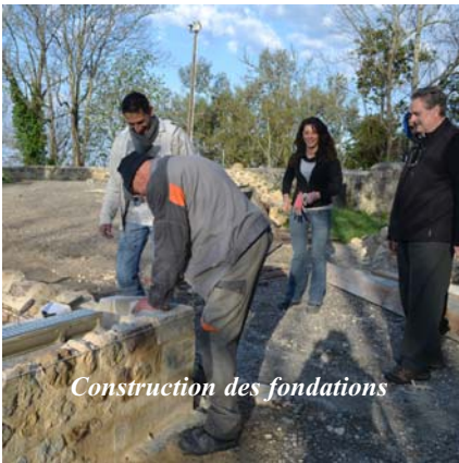
Construction des fondations