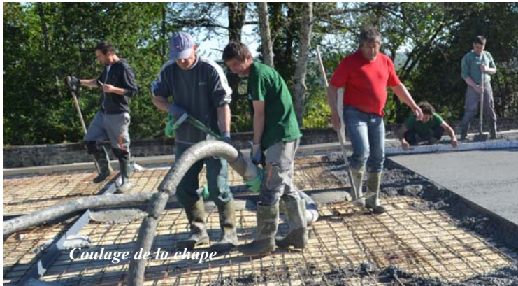
Coulage de la chape

Cette spectaculaire opération a été menée avec l'aide d'un bras hydraulique long de 50 mètres. Les toupies de béton et le camion pompe étant positionnés sur l'allée en contrebas du château, c'est par une flèche dressée au-dessus des remparts que, toute la matinée, le béton a été acheminé jusqu'à la plate-forme sur laquelle les équipes se relayaient pour tirer et niveler la chape... Un travail laborieux mais enthousiasmant pour le groupe, car maintenant, les travaux de reconstitution du mur de façade vont pouvoir commencer !