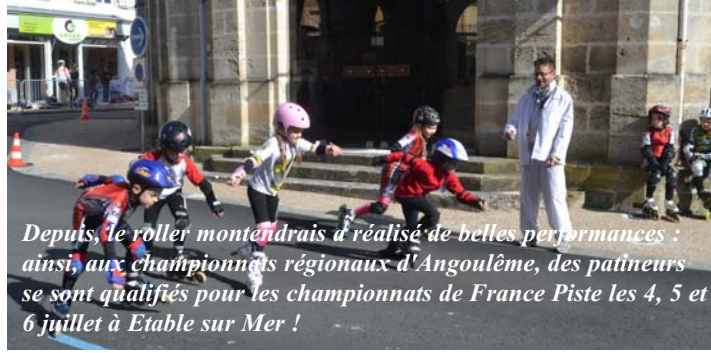
Depuis, le roller montendrais a réalisé de belles performances : ainsi, aux championnats régionaux d'Angoulême, des patineurs se sont qualifiés pour les championnats de France Piste les 4, 5 et 6 juillet à Etable sur Mer !