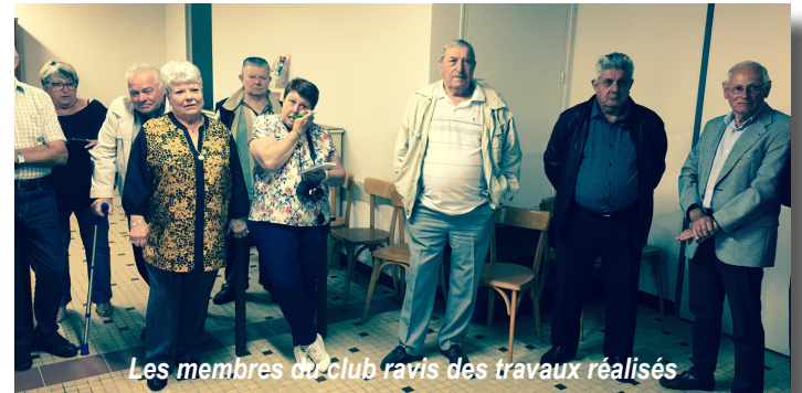
Les membres du Club ravis des travaux réalisés

Ils attendaient ça depuis l'automne quand ont débuté les travaux de rénovation du club situé rue de la Motte à Vaillant... Courant mai, les membres du mamie-papi club ont pu réintégrer avec un vrai plaisir "leurs murs", réinvestissant un local plus vaste, repeint de frais et disposant de sanitaires refaits à neuf. Un peu comme pour une crémaillère, ils y ont convié le maire et ses adjoints pour partager le verre de l'amitié.