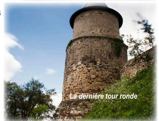
La dernière tour ronde

jeunes internationaux et personnes en insertion professionnelle, qui viennent s'initier au travail de la pierre et de la maçonnerie, un chantier qui se déroule dans l'esprit de solidarité si particulier à Montendre.