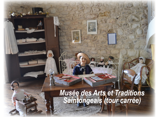
Musée des Arts et Traditions Saintongeais (tour carrée)

En 2014, à l'entrée du château, l'esplanade François de La Rochefoucauld est aménagée autour de la pierre tombale du dernier marquis de Montendre. La municipalité entreprend aussi de faire déposer les vestiges de la façade du XVIIIe siècle et de la reconstruire à l'identique, afin de préserver la sécurité des visiteurs tout en conservant la mémoire du lieu. Ce chantier devient un véritable chantier-école, où se côtoient