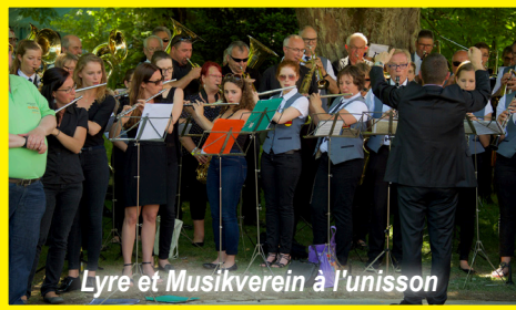
Lyre et Musikverein à l'unisson