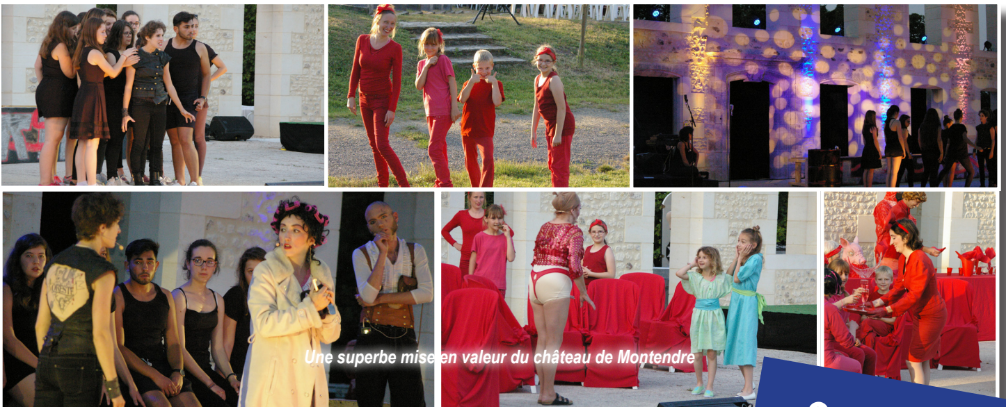
Une superbe mise en valeur du château de Montendre

Ce projet était soutenu financièrement par : le Conseil Régional Nouvelle-Aquitaine, la DRAC, Le programme Leader-Union européenne, la CDCHS, la Mairie de Montendre.