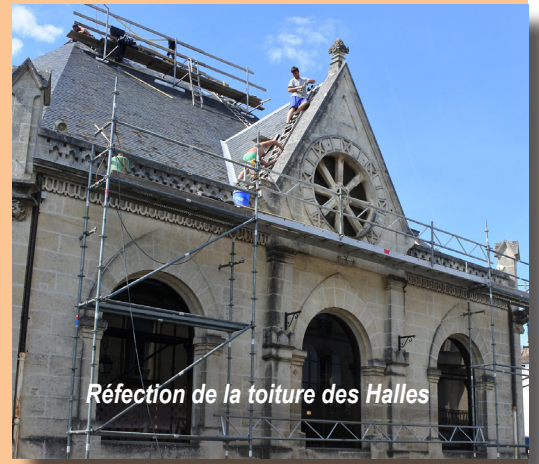
Réfection de la toiture des Halles

Construites en 1863, ces halles dont la charpente est remarquable, avaient failli disparaître au cours des années 70, jugées par certains trop anciennes et vétustes. Il fallut un referendum pour trancher l'épineuse question : à 56,3 %, les électeurs montendrais décidèrent de la rénovation et de la conservation des halles : ouf ! Les travaux furent réalisés en 1977 et 1978.