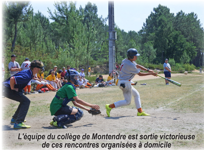
L'équipe du collège de Montendre est sortie victorieuse de ces rencontres organisées à domicile

club de Montendre et du Comité Départemental Olympique et Sportif de Charente-Maritime.