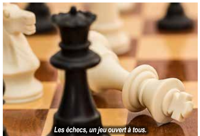
Les échecs, un jeu ouvert à tous.