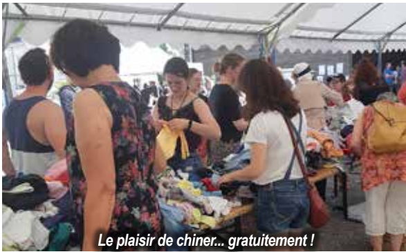
Le plaisir de chiner... gratuitement !

Économiser en récupérant des objets de seconde main, limiter le gaspillage en donnant plutôt qu'en jetant, voilà des comportements plus vertueux, désormais passés dans les mœurs et c'est tant mieux pour l'environnement !