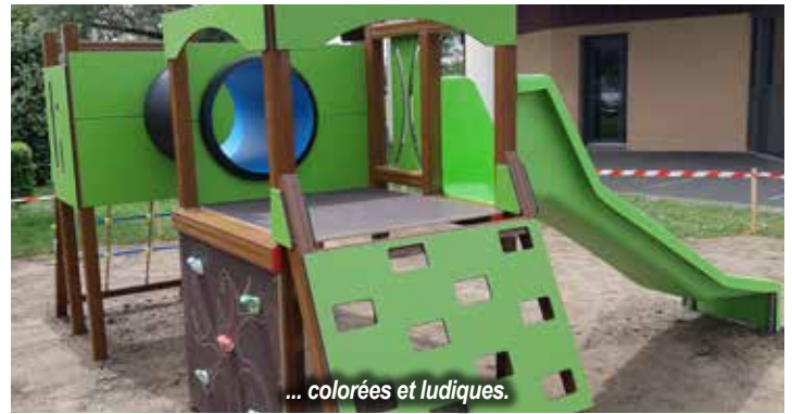
... colorées et ludiques.