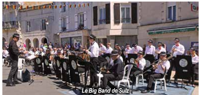
Le Big Band de Sulz