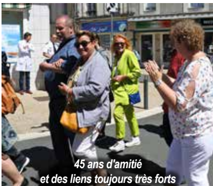
45 ans d'amitié et des liens toujours très forts