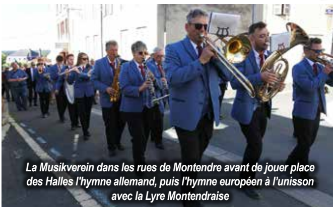
La Musikverein dans les rues de Montendre avant de jouer place des Halles l'hymne allemand, puis l'hymne européen à l'unisson avec la Lyre Montendraise