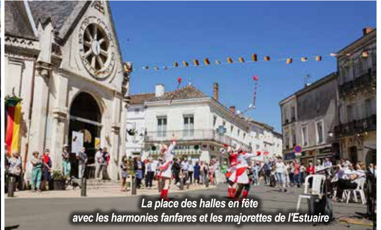
La place des halles en fête avec les harmonies fanfares et les majorettes de l'Estuaire