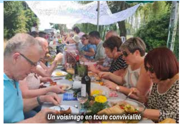
Un voisinage en toute convivialité