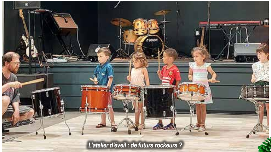
L'atelier d'éveil : de futurs rockeurs ?

Se sont ainsi succédés l'Atelier d'Éveil Musical, la chorale de la Rockschool de Montendre et de St-Aigulin, les groupes On Stage , l'atelier des P'tits Rockeurs , les ateliers Hip-Hop ainsi que ceux de jeux en groupe ! Pour toujours plus de rock, la soirée s'est achevée avec le concert des Twin Souls !