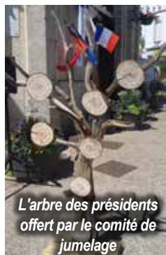
L'arbre des présidents offert par le comité de jumelage