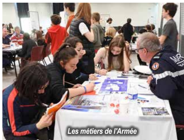
Les métiers de l'Armée