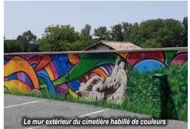
Le mur extérieur du cimetière habillé de couleurs