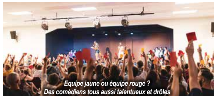
Equipe jaune ou équipe rouge ? Des comédiens tous aussi talentueux et drôles