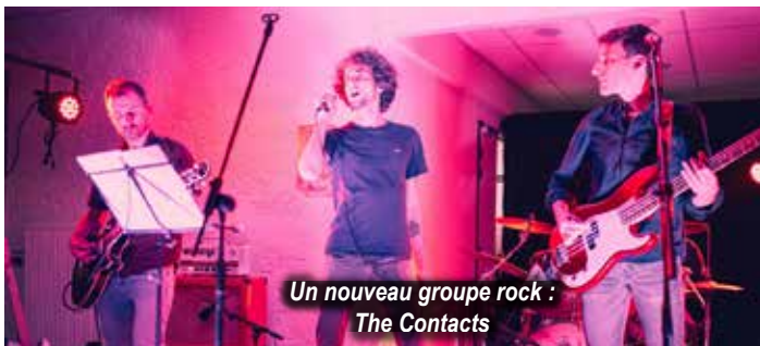
Un nouveau groupe rock : The Contacts