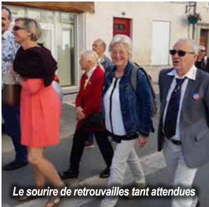
Le sourire de retrouvailles tant attendues