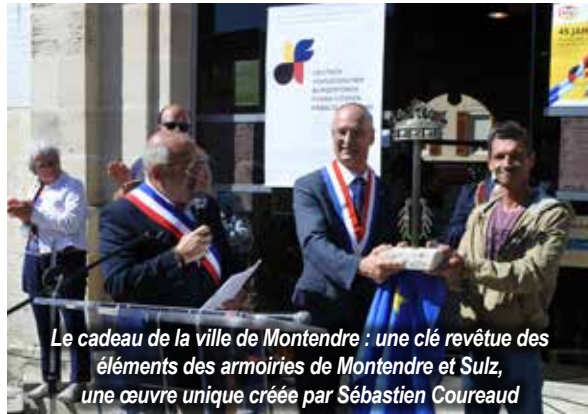
Le cadeau de la ville de Montendre : une clé revêtue des éléments des armoiries de Montendre et Sulz, une œuvre unique créée par Sébastien Coureaud