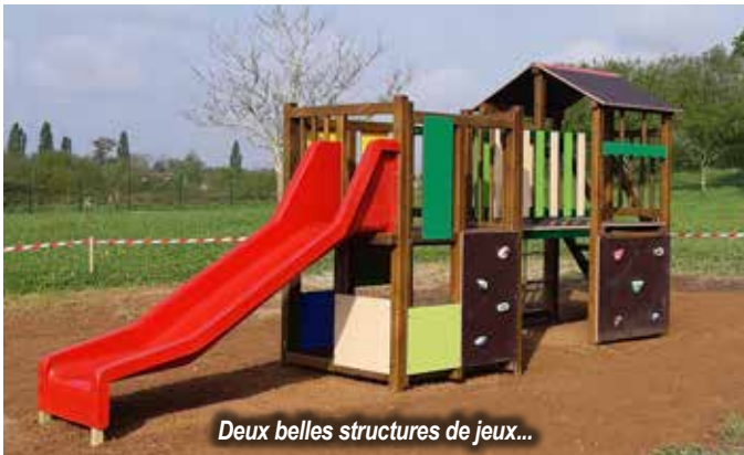
Deux belles structures de jeux...