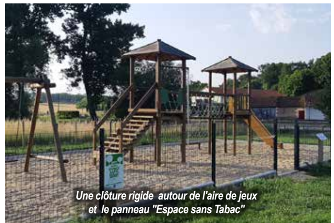
Une clôture rigide autour de l'aire de jeux et le panneau "Espace sans Tabac"