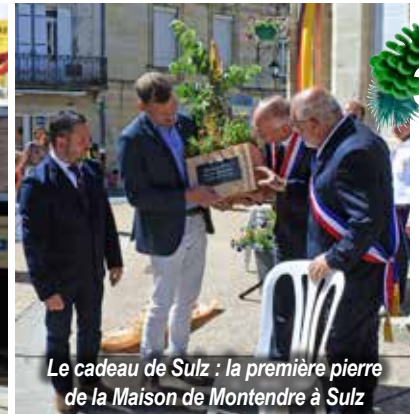
Le cadeau de Sulz : la première pierre de la Maison de Montendre à Sulz