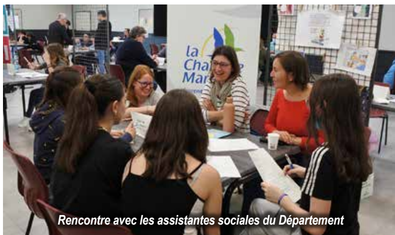
Rencontre avec les assistantes sociales du Département