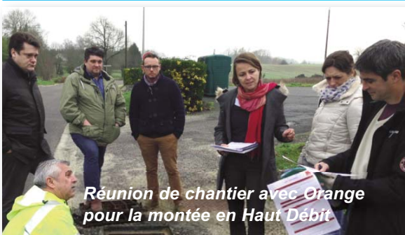
Réunion de chantier avec Orange pour la montée en Haut Débit

Après avoir souhaité à tous une année douce, humaine, solidaire et fraternelle, il était l'heure de partager la galette et le verre de l'amitié.