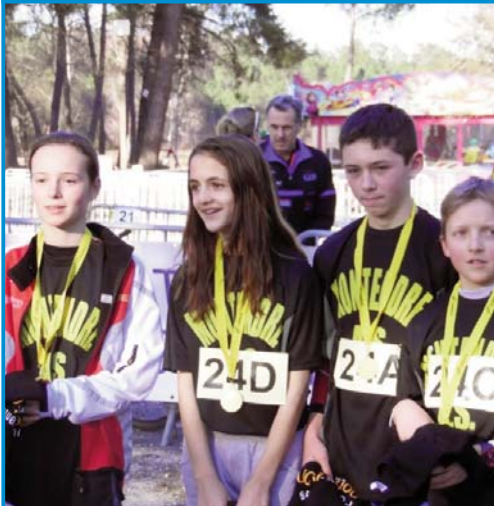
U comme UNSS : 4 collégiens montendrais champions régionaux de Run and Bike !