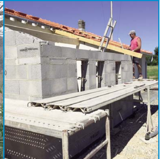
W comme les WC de l'école de Chardes, agrandis et refaits à neuf.