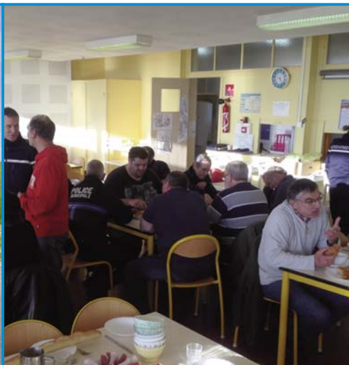
B comme Bénévoles de la foire du 11 novembre : nombreux, ils gardent la ville de nuit avant de partager le petit déjeuner !