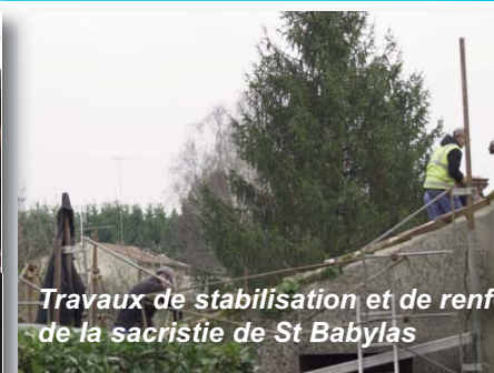
Travaux de stabilisation et de renforcement de la sacristie de St Babylas