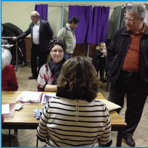
R comme les élections Régionales organisées en décembre pour désigner les conseillers de la nouvelle grande Région ALPC.