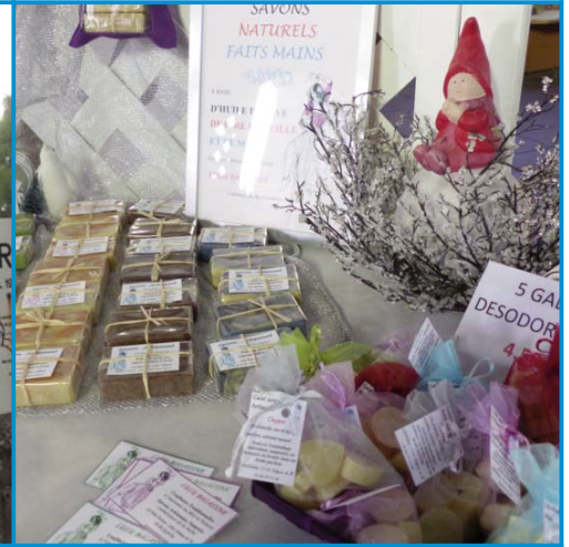
T comme Talents d'Artisans exposés sous les halles pour de jolis cadeaux de fin d'année.