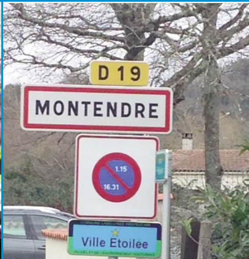
V comme le label Ville étoilée attribué à Montendre pour ses efforts en matière de diminution de la pollution lumineuse.