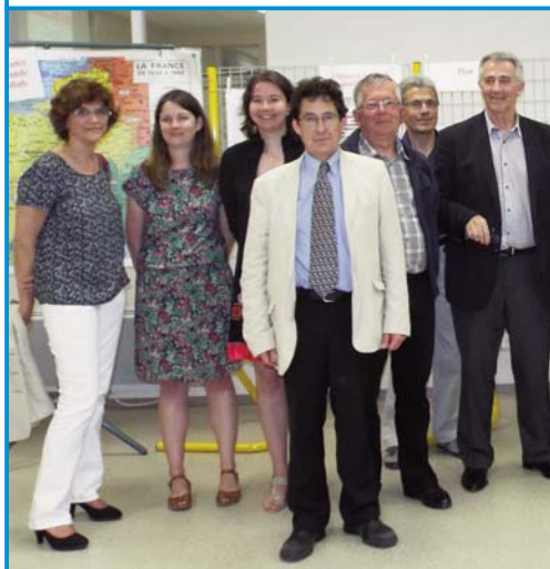
D comme Duménieu : les 3e du collège qui porte son nom ont rendu un bel hommage à ce résistant, défenseur de l'école laïque.