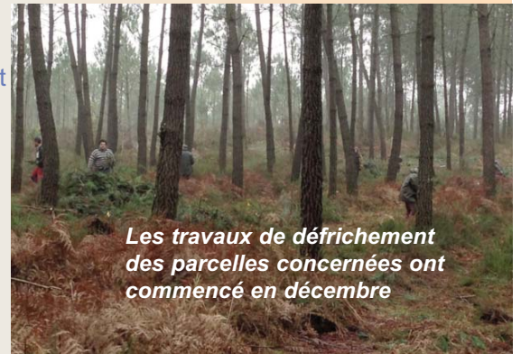
Les travaux de défrichage des parcelles concernées ont commencé en décembre