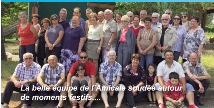
La belle équipe de l'Amicale soudée autour de moments festifs...