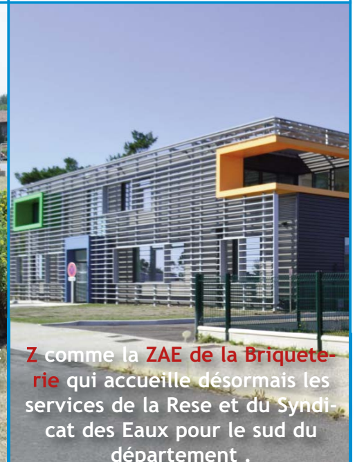
Z comme la ZAE de la Briqueterie qui accueille désormais les services de la Rese et du Syndicat des Eaux pour le sud du département .