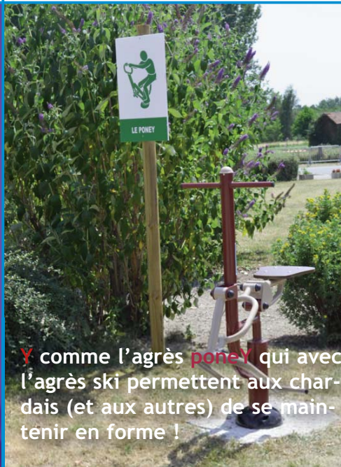
Y comme l'agrès poney qui avec l'agrès ski permettent aux charçais (et aux autres) de se maintenir en forme !