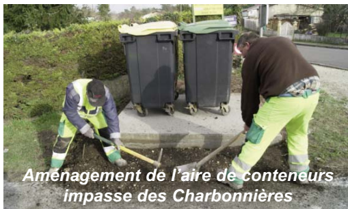
Aménagement de l'aire de conteneurs impasse des Charbonnières

Les travaux sont effectués en régie par les services techniques qui ont déjà réalisé l'aire en béton de plusieurs sites : route de Jussas, entrées de l'impasse des Charbonnières et de l'impasse des Châtaigniers, avenue de la Gare et prochainement rue de la Grève. Ces premiers travaux seront complétés par l'implantation de brise-vues. D'ici deux ans, l'ensemble des aires à poubelles auront ainsi été réaménagées à neuf avec un socle béton pour la propreté et des palissades pour l'aspect esthétique.