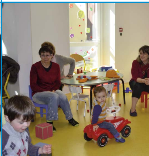
E comme petite Enfance : première année d'existence pour le RAM des 3 Monts, au service des familles et des professionnels.