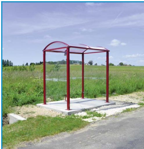
A comme Abri-bus à Vallet, implanté en bord de RD 155 pour la sécurité des scolaires.