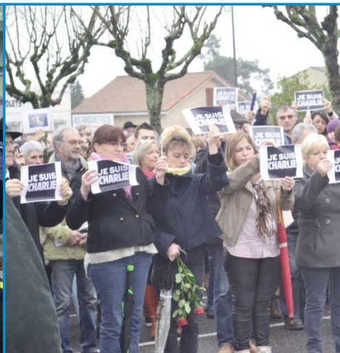
C comme CHARLIE : 10 janvier, un rassemblement triste et digne pour la liberté d'expression et à la mémoire des victimes.