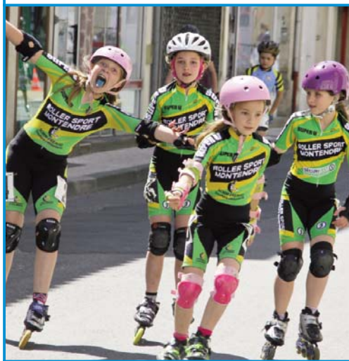
G comme les spectaculaires Glissades lors de la 2e Roller Montendraise en mai