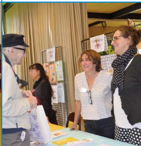
F comme Forum des associations : une belle journée de rencontres et d'échanges organisée par la mairie en septembre.