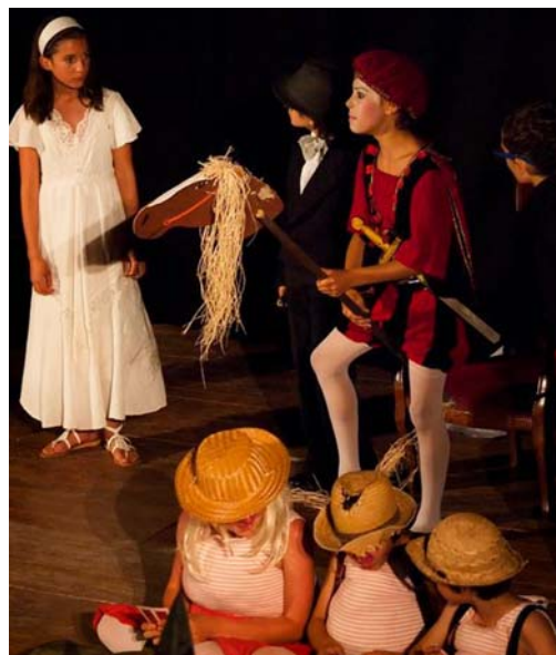
Les troupes de la Machine à Bulles : des jeunes comédiens amateurs, talentueux et débordant d'énergie