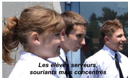
Les élèves serveurs, souriants mais concentrés