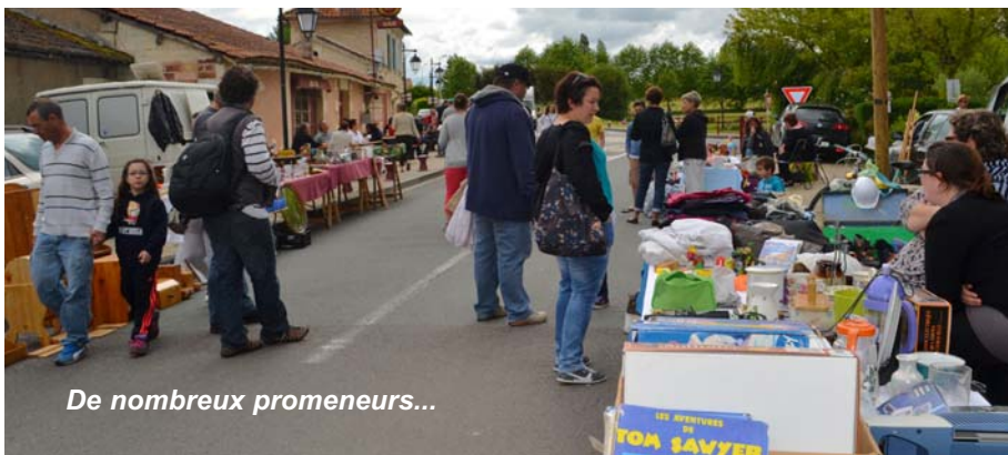
De nombreux promeneurs...