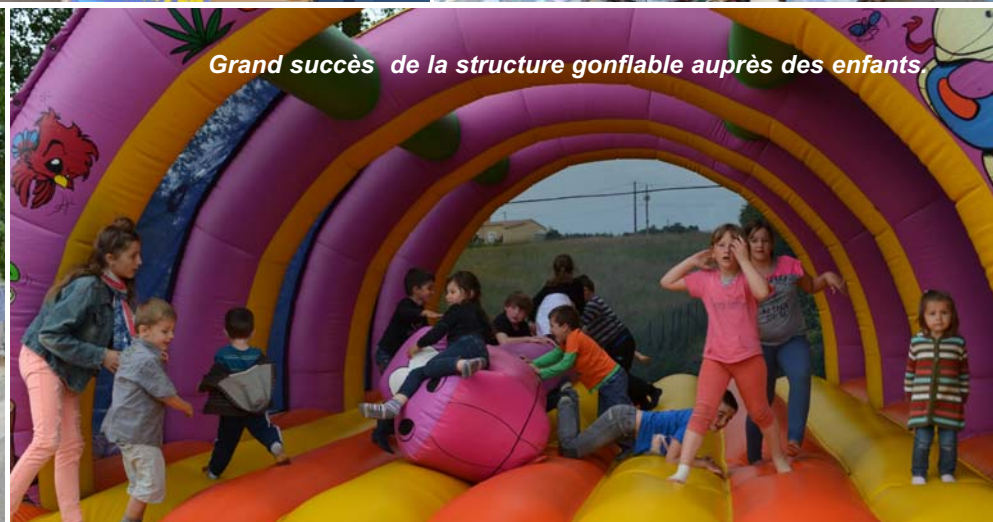
Grand succès de la structure gonflable auprès des enfants.