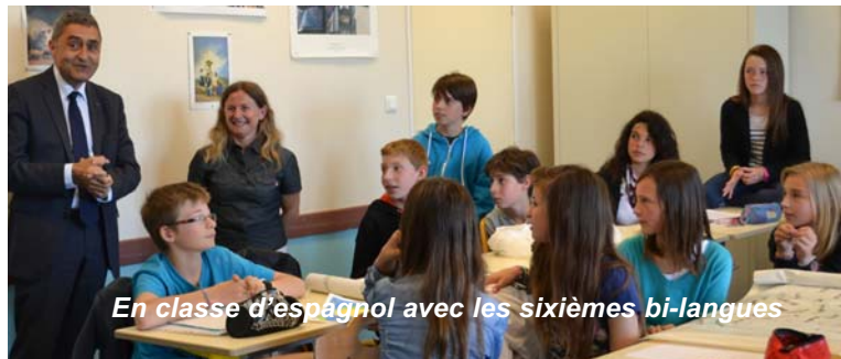
En classe d'espagnol avec les sixièmes bi-langues