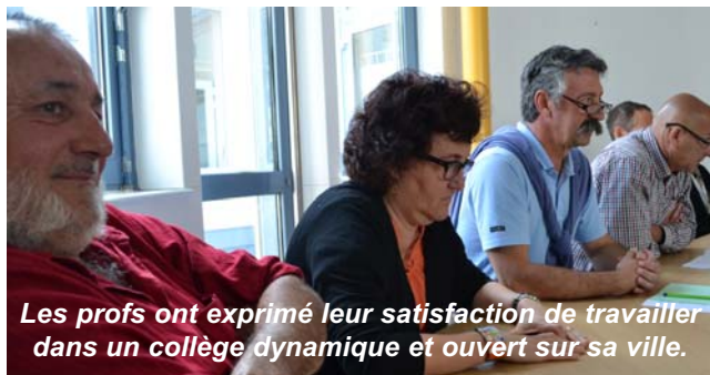
Les profs ont exprimé leur satisfaction de travailler dans un collège dynamique et ouvert sur sa ville.