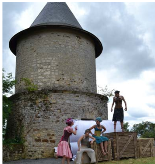
DDM : une fenêtre ouverte sur les arts du spectacle... tous azimuts.