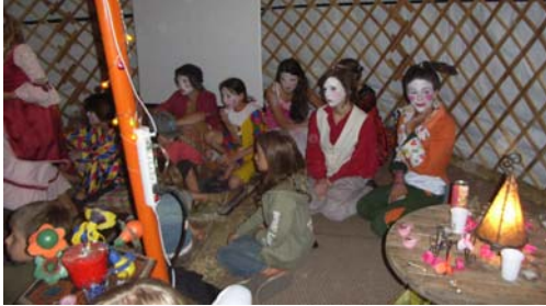
DDM 2008 : rencontres avec les comédiens et échanges après les spectacles dans la tente à palabres.