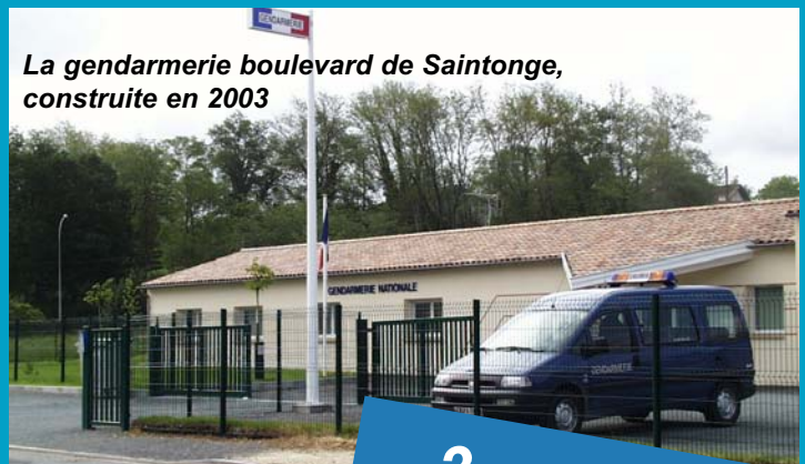
La gendarmerie boulevard de Saintonge, construite en 2003

En conséquence, la commune reversera au SIVOS les sommes prévues par le fonds d'amorçage pour la réforme des rythmes scolaires, de même que celles éventuelles dues au titre de la dotation de solidarité rurale, correspondant au nombre d'élèves scolarisés dans les écoles de Chardes et Vallet.