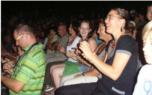
LE public de DDM : toujours plus nombreux et enthousiaste !