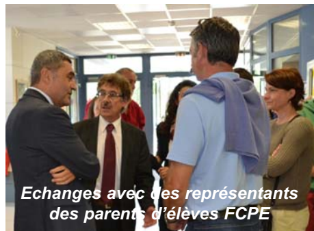
Echanges avec des représentants des parents d'élèves FCPE