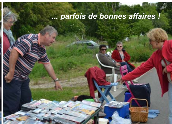
... parfois de bonnes affaires !