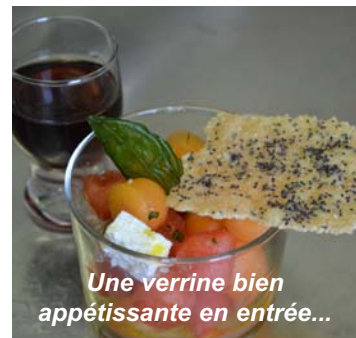
Une verrine bien appétissante en entrée...