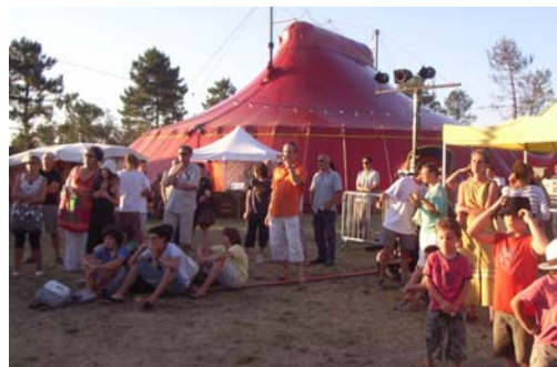
Ambiance de fête avec le chapiteau